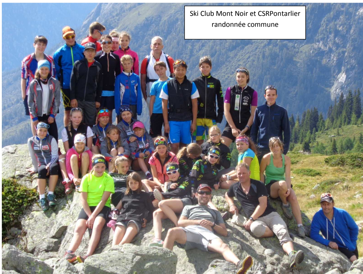
Ski Club Mont Noir et CSRPontarlier randonnée commune