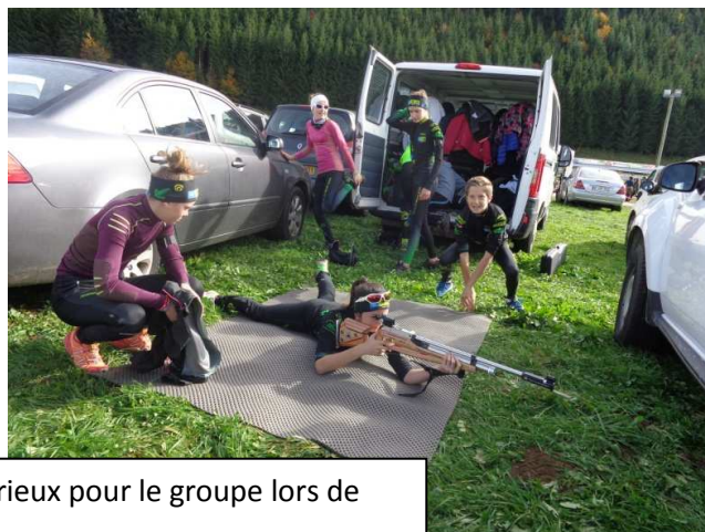
Un beau podium et du sérieux pour le groupe lors de l'échauffement.