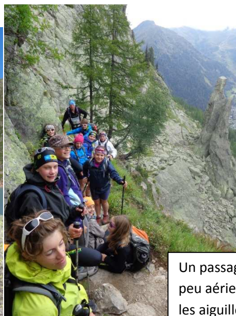
Un passage un peu aérien vers les aiguilles d'Argentières