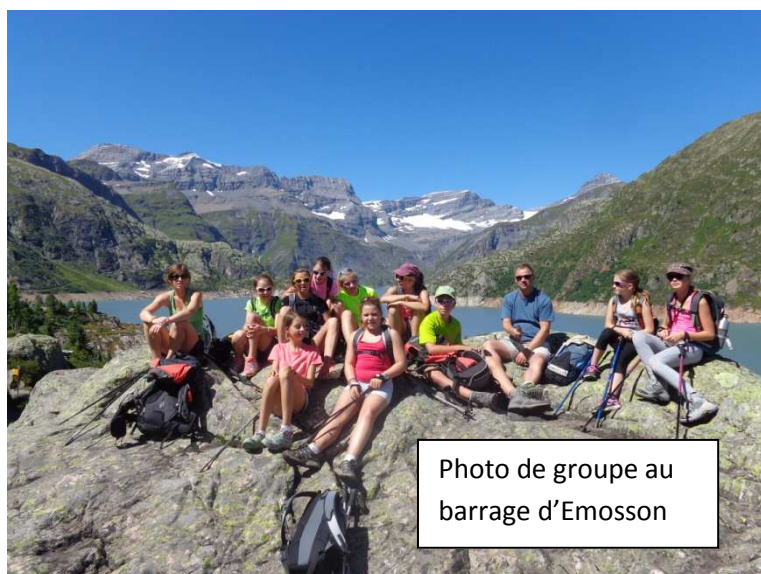
Photo de groupe au barrage d'Emosson

5 jours de randonnées au cœur du massif du Mont Blanc nous ont permis de développer une bonne endurance de base. Nous avons parcouru les chemins de randonnées durant de longues heures pour découvrir des sites magnifiques. Le Lundi nous avons découvert le barrage d'Emosson, Mardi les Aiguillettes des Posettes et le Col de Balme , Mercredi Le Lac Blanc, Jeudi L'alpage de la Loriaz , le col de fenêtre , les traces de Dinosaures et les Gorges de la Veudale et le Vendredi Le bel Oiseau. Un beau stage qui, je l'espère, aura rempli les têtes d'images et de souvenirs. Nous avons fait une sortie commune avec les skieurs de Pontarlier qui se trouvaient eux aussi en stage sur le secteur, ce fut une superbe journée d'échange avec d'autres sportifs.