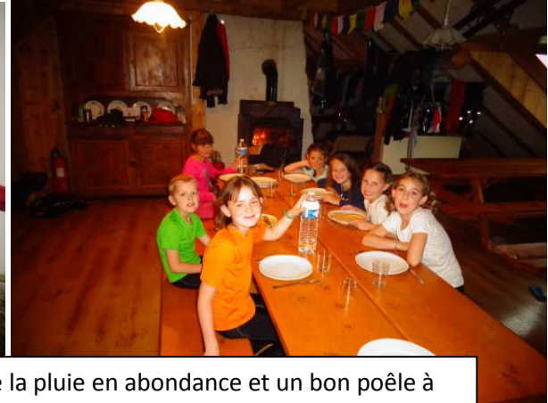
De la pluie en abondance et un bon poêle à bois pour nous réchauffer.