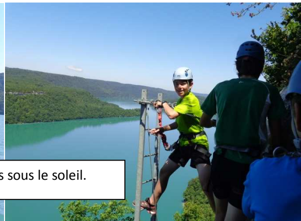
Bellecin un petit Paradis sous le soleil.